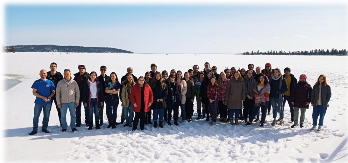
Участники школы-практики полярных лимнологов 2021 года на льду оз. Имандра

Мероприятие запланировано на 12-18 апреля 2026 года . Местом проведения станет комплексный мониторинговый полигон Кольского научного центра РАН, расположенный в 20 км от г. Апатиты (Мурманская область) на берегу озера Имандра. Примерное число участников (студентов, аспирантов, молодых ученых) – 30 человек.