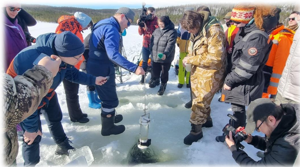
Демонстрация отбора проб воды оз. Имандра во время полевой практики в 2023 году

промышленной экологии Севера КНЦ РАН (Апатиты) и других организаций прочтут лекции на различные темы, посвященные вопросам изучения пресноводных водоемов Севера и Арктики России.