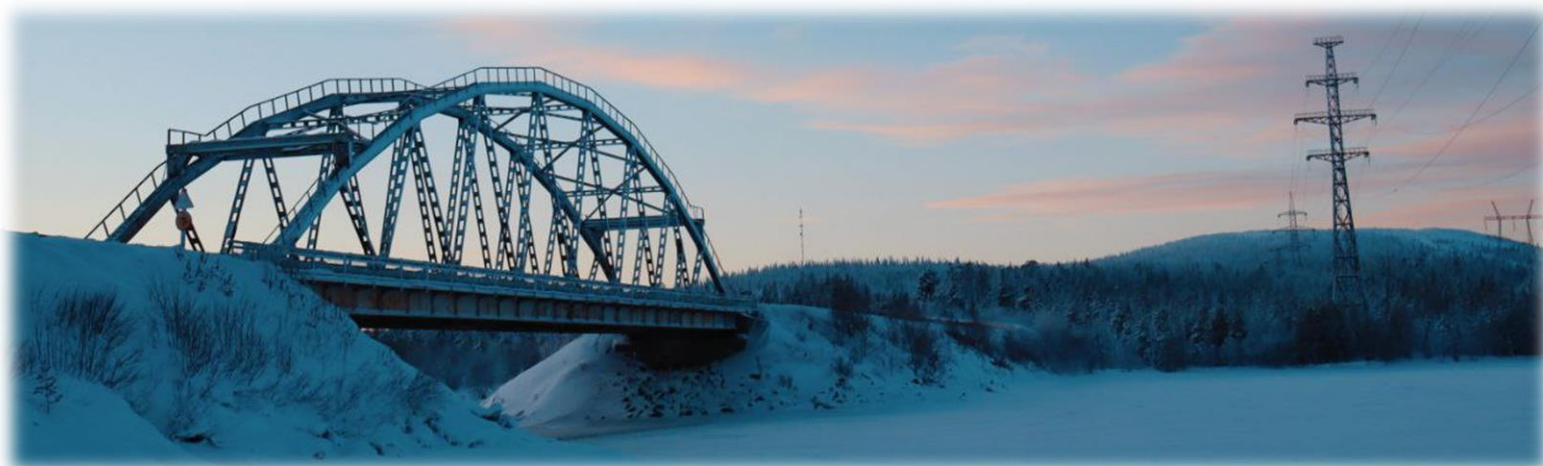
Вид на озеро Имандра зимой в районе пролива Йокостровского